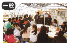
一般 NPOみんなの畑の会 × 農業水産振興課、森林再生課

(20年後の四十万の里地、里山を 子ら孫らの時代の故郷の環境 づくりを楽しみながら目指そう)