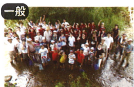
一般 夕日寺1300年協議会 × 文化財保護課、環境政策課