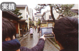
実績 石川工業高等専門学校 建築学科 道地慶子研究室+越野亮 × 文化財保護課、歴史都市推進課