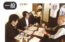
一般 アレルギーっ子サークルの交流会 るみえ〜る × 観光政策課

(D&I(ダイバーシティ&インクルージョン)の理念で共生社会を創造!! ~金沢市の視覚障害者就労に新しい風を~)