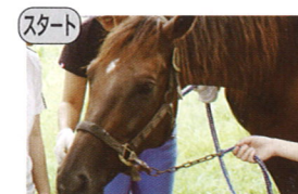
スタート 金沢市馬術協会 ホースセラピーを進める会 × 健康政策課

※(スタート)…スタート部門、(一般)…一般部門、(実績)…採択実績団体部門、(学生)…学生部門 ※各団体名の下の( )は企画テーマです。