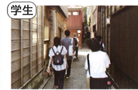
学生 金澤町家学生会議 ( 若者目線の町家発信 )