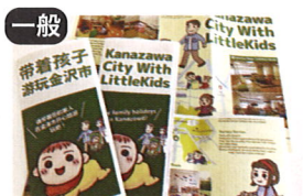
一般 子育て向上委員会 × こども政策推進課