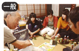
一般 金澤ふるさと倶楽部 × 文化政策課

(20年後の四十万の里地、里山を 子ら孫らの時代の故郷の環境 づくりを楽しみながら目指そう)