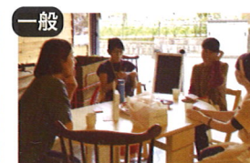
一般 NPOひいなアクション × 文化政策課