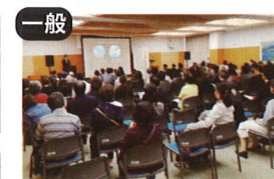
一般 「あわ」視覚障害者の働くを考える会 × 障害福祉課、労働政策課、健康政策課

(D&I(ダイバーシティ&インクルージョン)の理念で共生社会を創造!! ~金沢市の視覚障害者就労に新しい風を~)