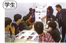
学生 KG都市研究所・魅力発見隊 (かなざわの「魅力」で「交流」する!)