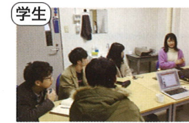
学生 石川工業高等専門学校豊島研究室 ( トリップギフト )