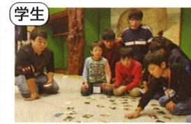
学生 KGチーム・MACHIYA (「町家で学ぶ、金沢の魅力」プロジェクト)