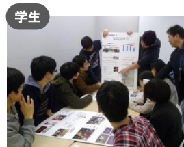
学生 KG都市研究所・魅力発見隊 かなざわの「魅力」で 「交流」する!