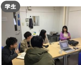
学生 石川工業高等専門学校豊島研究室 トリップギフト