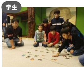
学生 KGチーム・MACHIYA 「町家で学ぶ、金沢の魅力」 プロジェクト