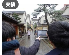
実績 石川工業高等専門学校建築学科 道地慶子研究室+越野亮 × 文化財保護課、歴史都市推進課 「城下町かなざわタイムトラベル VR」でまち歩きを楽しもう!