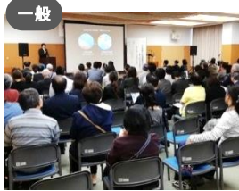
一般 「あうわ」視覚障害者の働くを考える会 × 障害福祉課、労働政策課、 健康政策課 D&I(ダイバーシティ&インクルージョン)の 理念で共生社会を創造!!～金沢市の 視覚障害者就労に新しい風を～