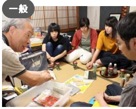
一般 金澤ふるさと倶楽部 × 文化政策課 紙資料が語る「モダン金沢」