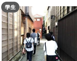
学生 金澤町家学生会議 若者目線の町家発信