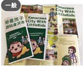
一般 子育て向上委員会 × こども政策推進課 【リーフレット】子連れで金沢 (英語版)&(中国語版)