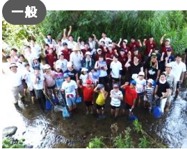
一般 夕日寺1300年協議会 × 文化財保護課、環境政策課 「夕日寺史跡環境整備と里山 環境確認」ウォッチング