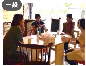
一般 NPOいいなアクション × 文化政策課 金沢発! 「アートと子育て」ネットワークの構築