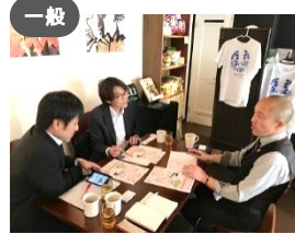
一般 アレルギー子サークルの交流会 るみえ～ × 観光政策課 金沢市食のバリアフリーマップ WEBサイトの構築