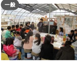
一般 NPOみんなの畑の会 × 農業水産振興課、森林再生課 20年後の四十万の里地、里山を 子ら孫らの時代の故郷の環境づくりを 楽しみながら目指そう